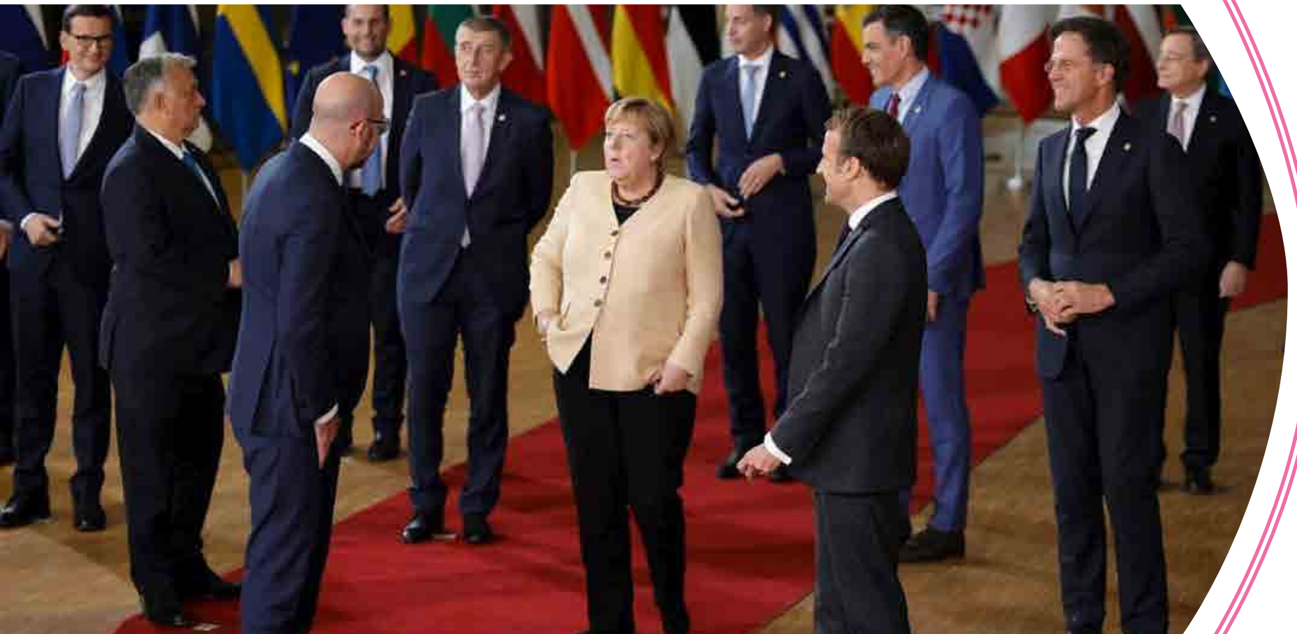
Pie de foto: la excanciller de Alemania Angela Merkel. Merkel presidió el G8 y también fue presidenta del Consejo Europeo, siendo la segunda mujer en la historia en desempeñar ambos cargos, solo precedida en dicho mérito por la ex-primer ministro del Reino Unido, Margaret Thatcher.

En los próximos años cada vez veremos más rostros femeninos en los puestos de poder político a nivel Latinoamericano y Centroamericano.