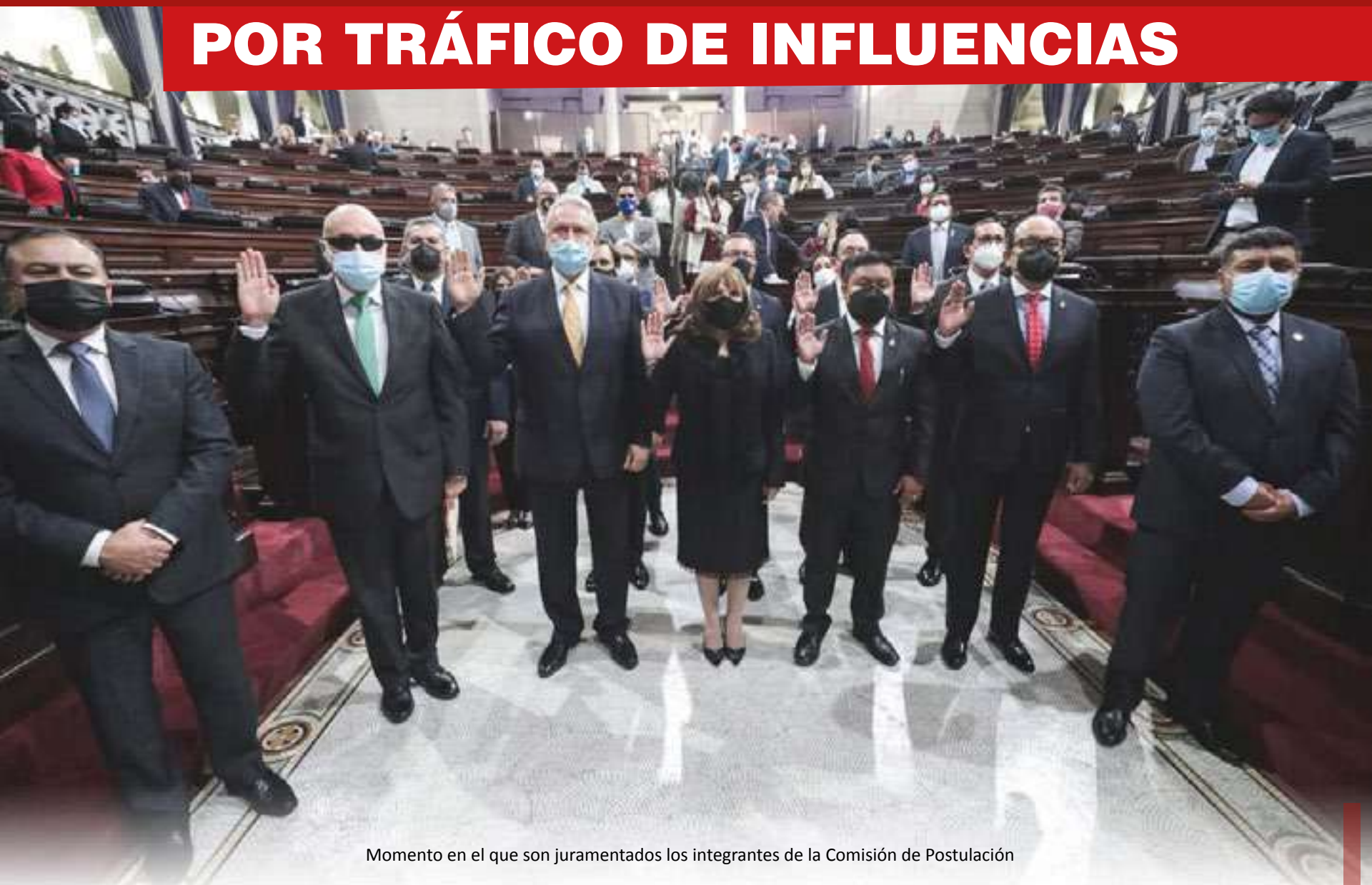
Momento en el que son juramentados los integrantes de la Comisión de Postulación

El proceso para elegir al nuevo Jefe del Ministerio Público dio inicio el pasado jueves cuando la mayoría de diputados del Congreso de la República convocó a la integración e instalación de la Comisión de Postulación para elegir al nuevo jefe del MP.