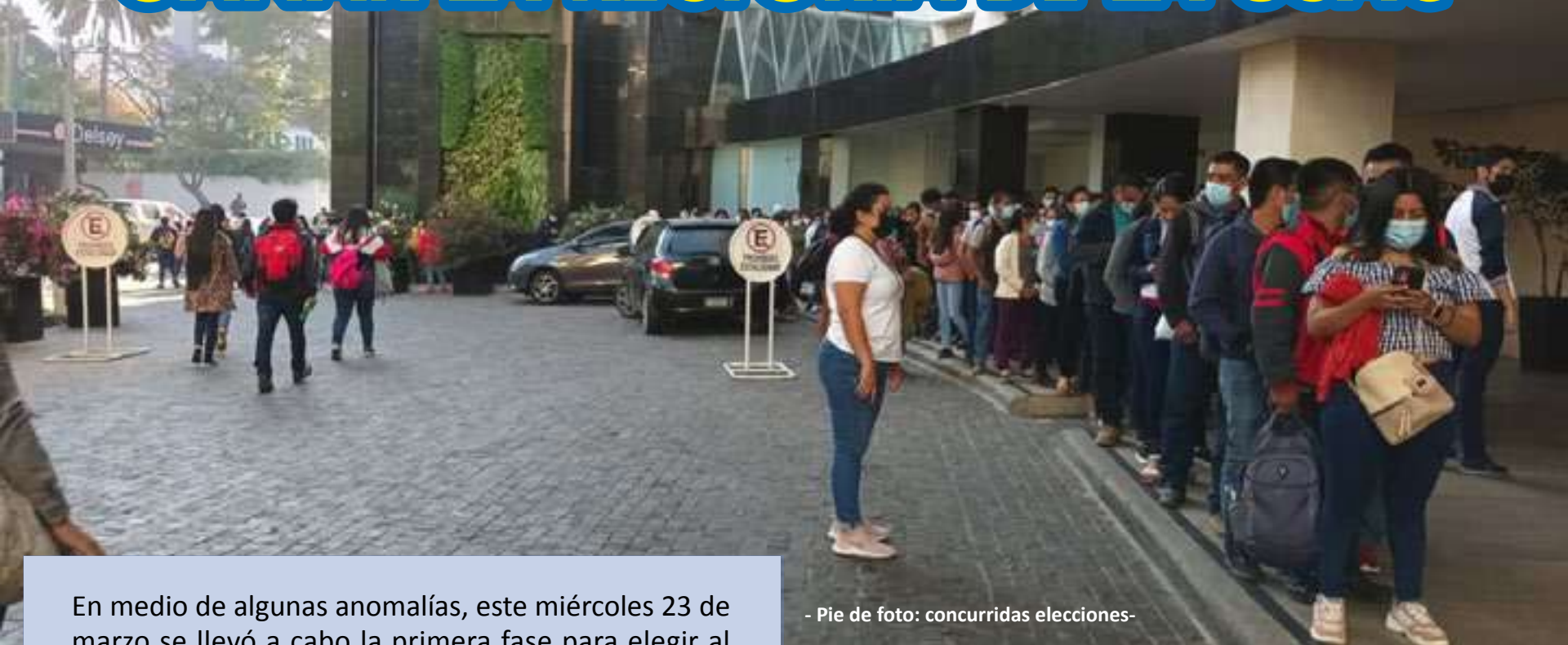
- Pie de foto: concurridas elecciones-

En medio de algunas anomalías, este miércoles 23 de marzo se llevó a cabo la primera fase para elegir al rector. La casa de estudios eligió a 170 representantes quienes el 27 de abril tienen que votar por el rector para el periodo 2022 – 2026.