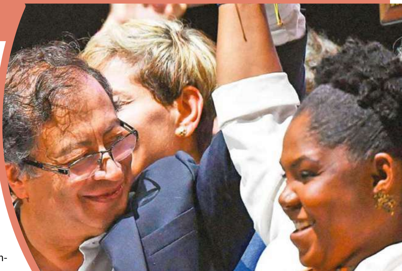
A partir del próximo 7 de agosto, Gustavo Petro y la vicepresidenta, Francia Márquez, dirigirán el gobierno colombiano.

En la vida hay que estar aferrado a los principios y valores en los que uno cree y creo que lo prudente es cumplir esa misión has-