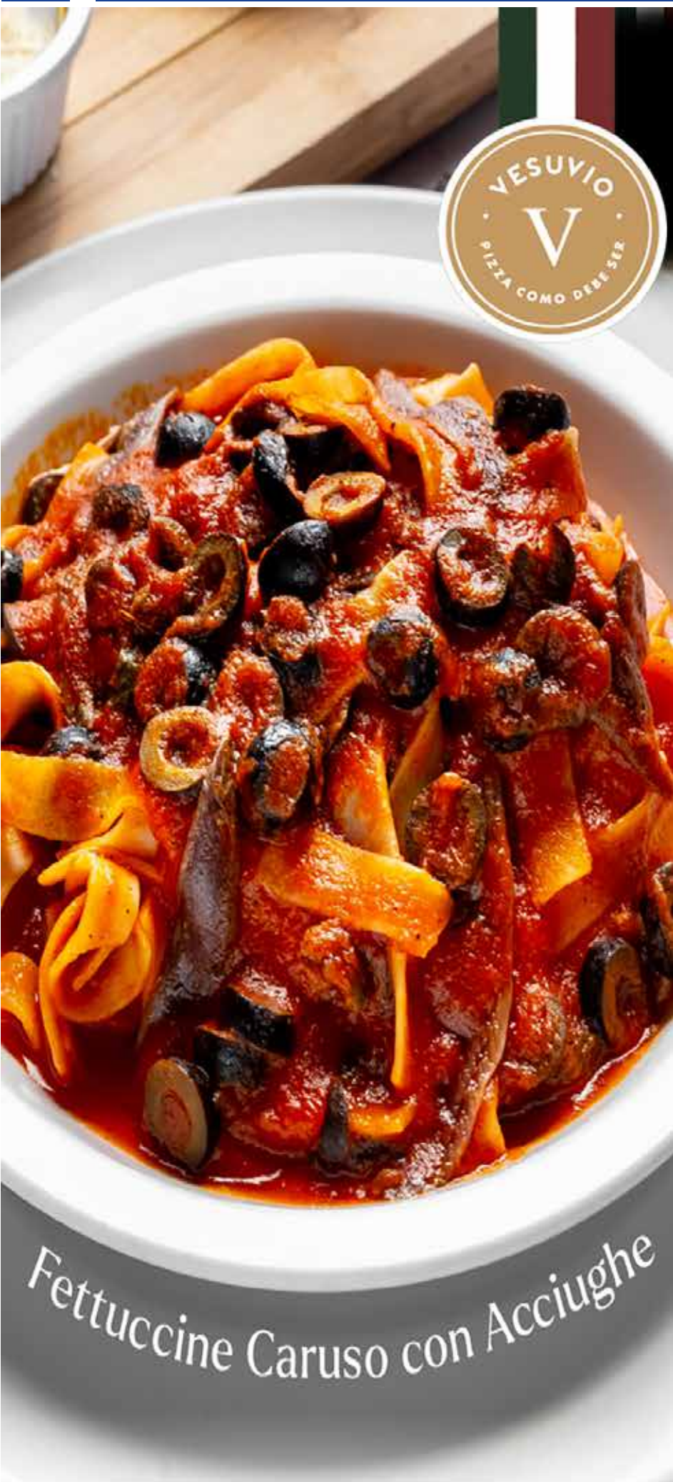
Fettuccine Caruso con Acciughe