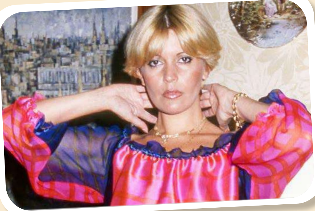
-La vedette Bárbara Rey, una de las amantes del rey Emérito Juan Carlos-

El rey Juan Carlos I se desboca en una vida licenciosa, que es tapada por el servicio secreto español, y que por todos los medios trata de salvarlo del escándalo. Pero su vida de juerga, poder y dinero mal habido, tiene sus consecuencias nefastas. Porque una de sus amantes, la vedette Bárbara Rey, coloca micrófonos y cámaras en la habitación y su sala, donde se veía con el rey Juan Carlos I, y graba todas sus visitas, en donde lo hacía hablar de los personajes políticos, sobre lo que pensaba de los presidentes, etc., para realizar un chantaje multimillonario, el cual es pagado por el servicio secreto español, y además exigía contar con un programa en el Canal de televisión español, el cual se le da.