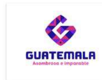
2022 - Guatemala asombrosa e imparable