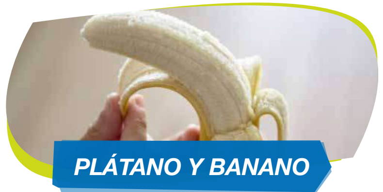
PLÁTANO Y BANANO