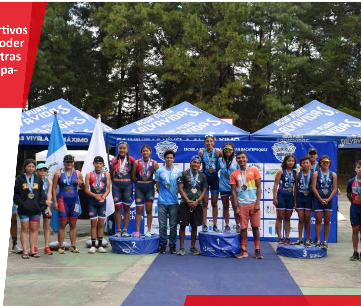
-Premiación de los ganadores del torneo de Triatlón Infanto Juvenil-

La Escuela Politécnica en San Juan Sacatepéquez, fue el escenario de las justas juveniles, realizadas el 26 y 27 de noviembre, con la presencia de Retalhuleu, Guatemala, Chimaltenango, Quetzaltenango, Escuintla, Jalapa, Totonicapán, Izabal, Huehuetenango y Santa Rosa.