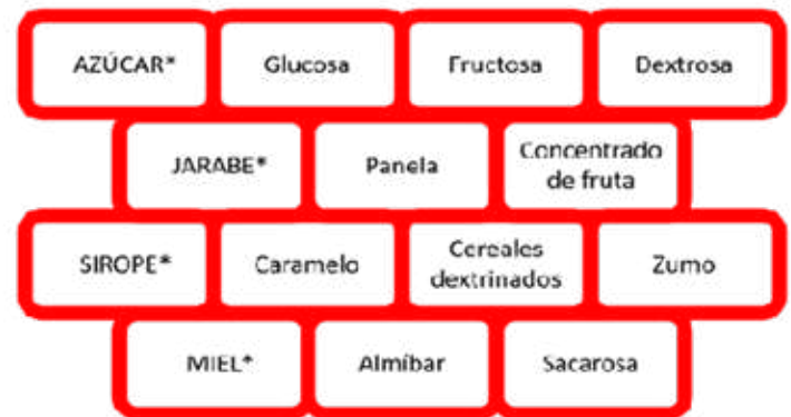
* Cualquier tipo de azúcar, jarabe, sirope o miel