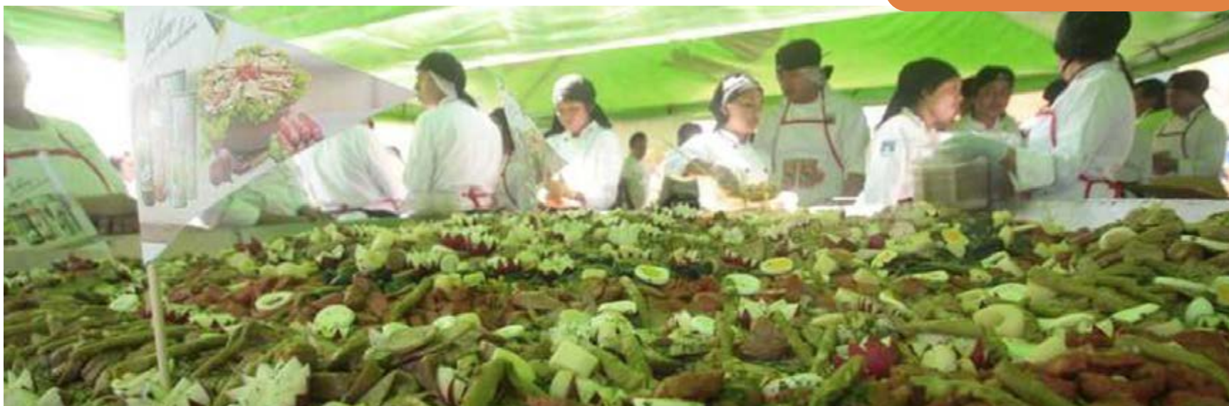
Foto archivo de evento El Fiambre más grande en años anteriores.