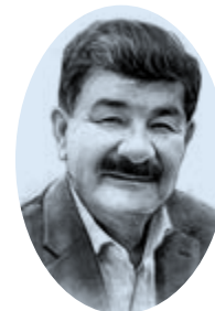
Por: Mario Fuentes Destarac

La clase política tampoco diseñó un sólido Estado de Derecho. Consecuentemente, la politización e inobservancia del principio meritocrático en la integración de la Corte de Constitucionalidad, la Corte Suprema de Justicia, la Corte de Apelaciones y la Contraloría de Cuentas dieron pie a la concentración y abuso de poder, la judicialización de la política, la criminalización de la libertad de expresión de ideas y la desinstitucionalización imperantes, así como que el gobierno de Guatemala ya no sea reconocido como una democracia plena ni tan siquiera disfuncional, sino como un régimen híbrido o una autocracia opresiva a secas. De hecho, la camarilla gobernante no fue invitada a las dos Cumbres Mundiales por la Democracia (2021 y 2023), convocadas por el gobierno de los EE.UU.; y, hoy en día, dicha camarilla está bajo una exhaustiva evaluación por el Consejo Permanente de la OEA, en el marco de la Carta