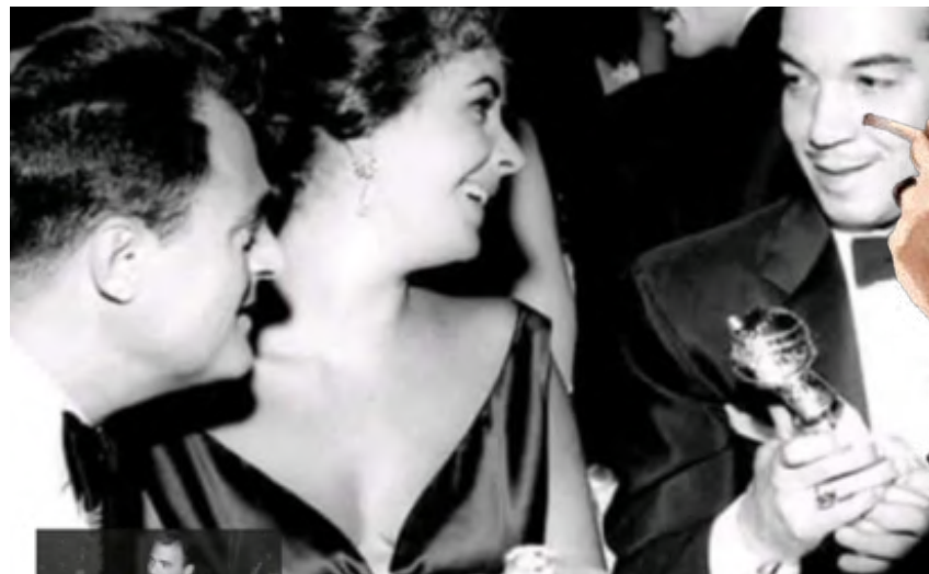
De izquierda a derecha: Michael Todd, Elizabeth Taylor y Mario Moreno, con su premio.

En 1957 se llevaron a cabo los Globos de Oro y Cantinflas no sólo estuvo nominado en la categoría de Mejor Actor