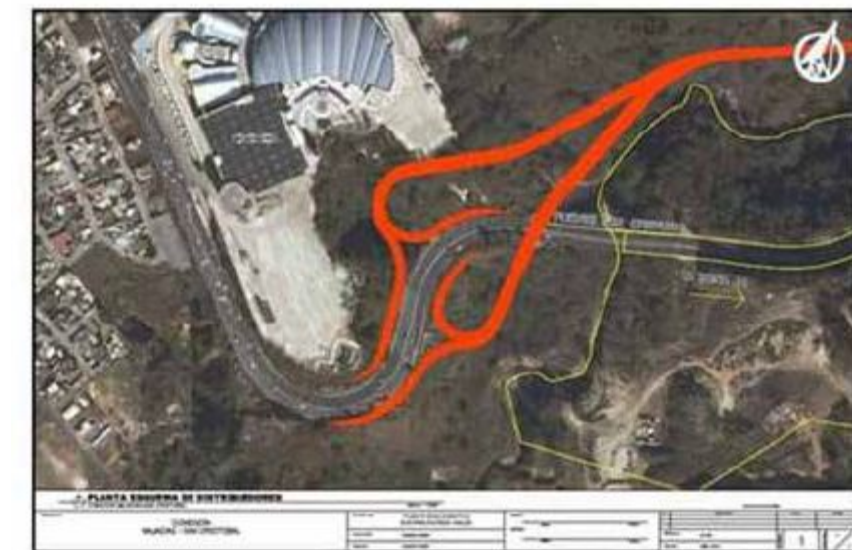
DISTRIBUIDOR DE TRAFICO PARA AREA DE MEGAFRATER EN SAN CRISTOBAL

Las ventajas de las carreteras privadas como estas se pueden resumir así: reducen el congestionamiento de vehículos; no tenemos que depender de que el Gobierno haga carreteras, sino que la inversión es completamente privada; la carretera es mucho más segura y eficiente que las estatales porque los dueños se preocupan por mantenerla en buen estado y con excelente señalización, ya que es de interés de los accionistas hacerla rentable; y finalmente el usuario tiene la alternativa de pagarla, de acuerdo al uso que haga de la misma. La escasez de las mismas hace que