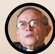
REFLEXIÓN DEL PADRE HUGO ESTRADA

de la mente de aquella mujer al borde de la muerte. Al igual que María Magdalena, la “ex adúltera” habrá enfilado por el camino de la santidad. Porque era casi imposible haber experimentado la compasión de Dios y volver a levantar su mano contra él. Nunca habrá olvidado sus persuasivas palabras: “Vete y no vuelvas a pecar” (Jn 8, 11). Imposible volver a intentar ir por la senda del adulterio y no recordar la mirada y la advertencia de Jesús. Esta mujer debe ser una de las santas anónimas de nuestro calendario.