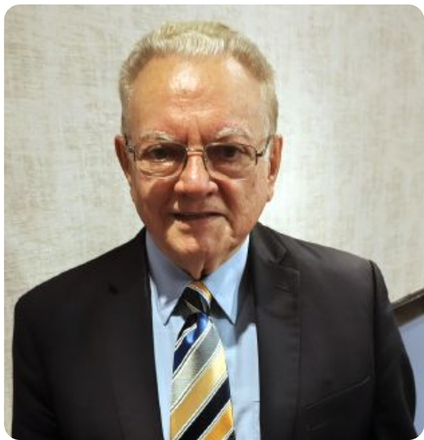
-Lic. Eduardo Stein.-

Eduardo Stein: Si, pero tienen que votar sobre un universo reducido de candidaturas. Y eso es lo crítico, poblar con gente proba el listado. Los diputados no pueden inventarse nuevas candidaturas, son las Comisiones de Postulación las que definen ese universo. Y es sobre este universo que los diputados tienen que votar.