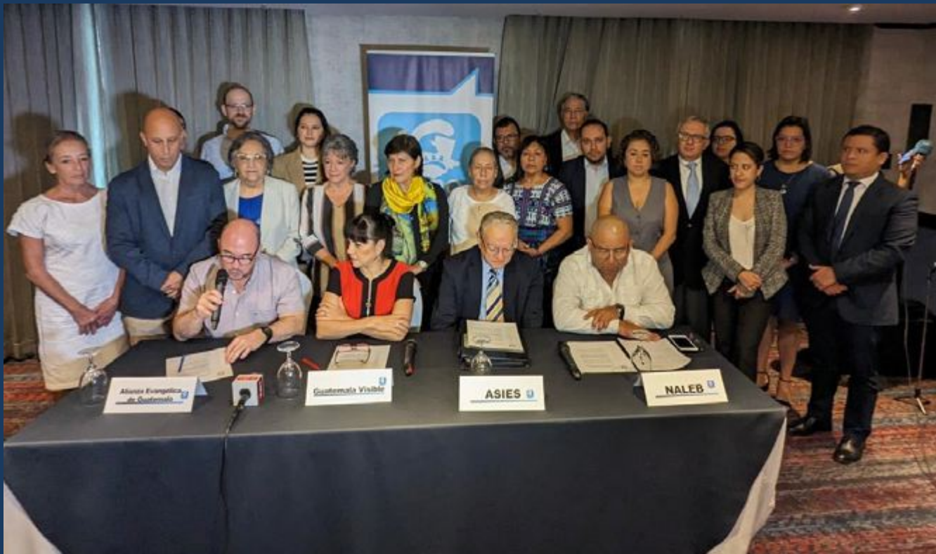
Uno de los miembros del “Foro Guatemala” es un distinguido político, que fue Canciller del gobierno del presidente Álvaro Arzú y vicepresidente de Oscar Berger, nos referimos al licenciado Eduardo Stein, con quien platicamos sobre el tema de la Elección de Cortes de Justicia. - Páginas 3 y 4-